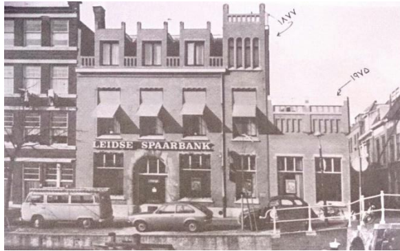
شکل ۲. دو بنا که با فاصله حدود صد سال ساخته شده است و در بنای جدید محتوای زمینه موجود در طرح جدید دیده شده است (حجت، ۲۰۱۲).